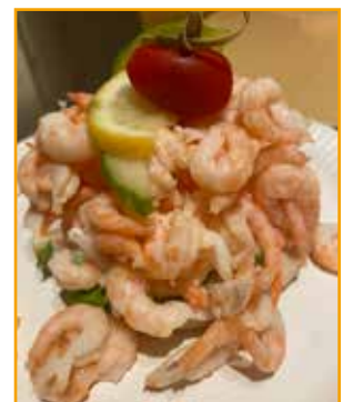
Räkmackan var också god!