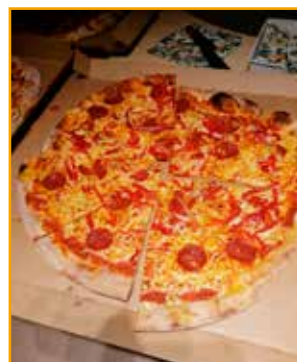
Pizza, oh, så gott!